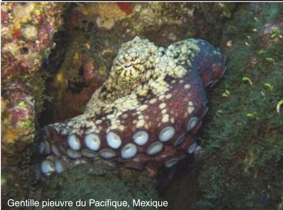
Gentille pieuvre du Pacifique, Mexique

Ajoutons aussi les pépins, à cause de l'équipement-photo, qui peuvent frustrer les plus tolérants.