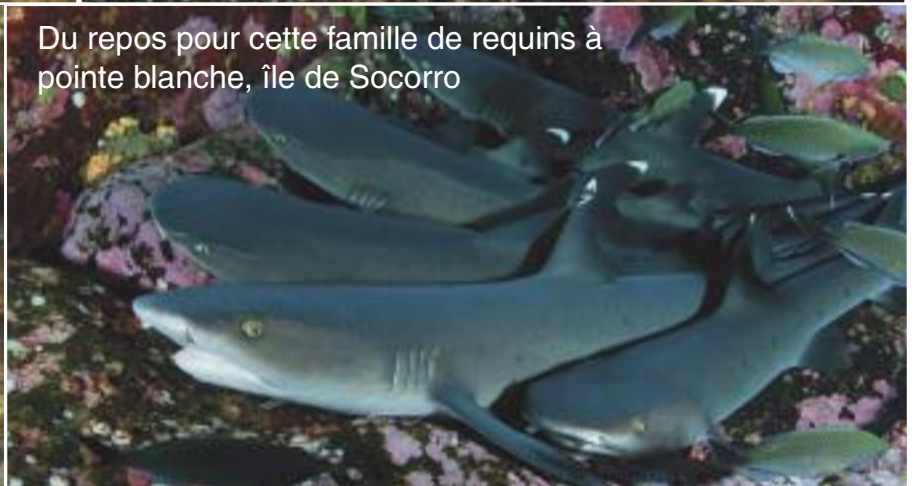
Du repos pour cette famille de requins à pointe blanche, île de Socorro