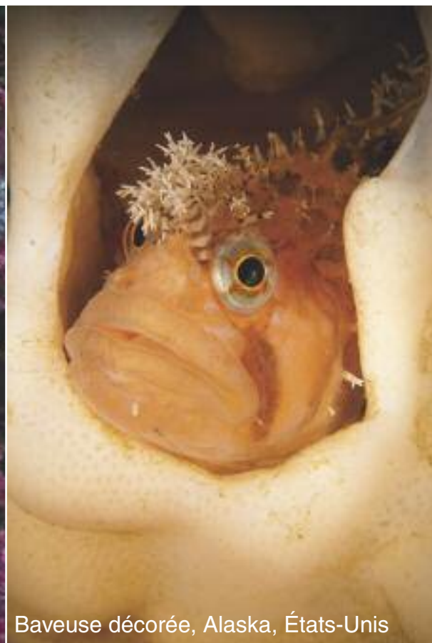
Baveuse décorée, Alaska, États-Unis

En effet, la plongée a un effet euphorisant et à la fois calmant. N'entendre que sa propre respiration dans un univers coloré et rempli de vie : rien au monde ne me relaxe davantage.