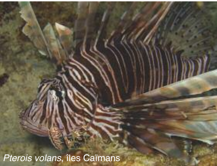
Pterois volans , îles Caïmans