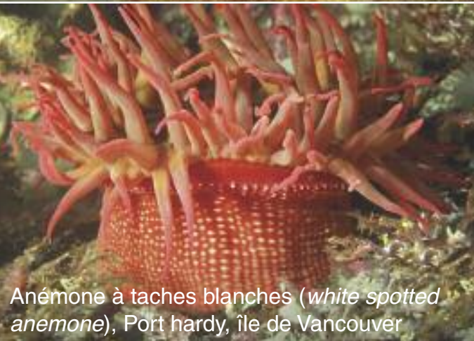
Anémone à taches blanches ( white spotted anemone ), Port hardy, île de Vancouver