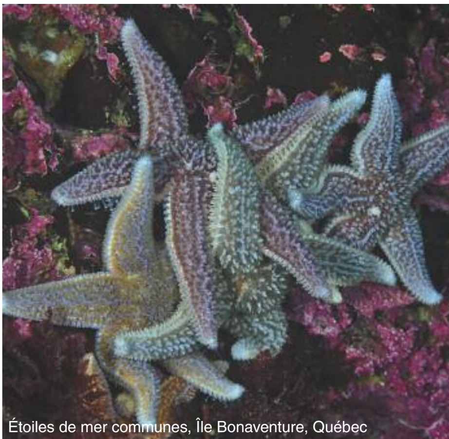
Étoiles de mer communes, Île Bonaventure, Québec