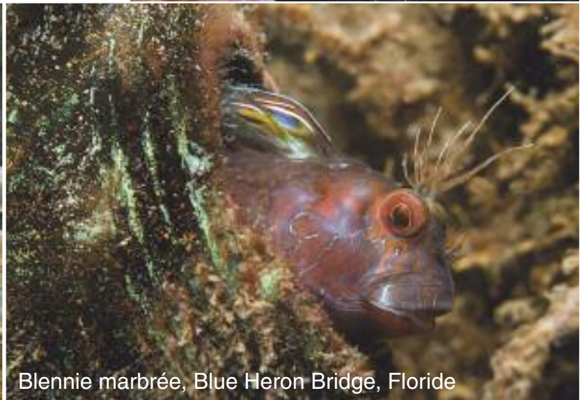
Blennie marbrée, Blue Heron Bridge, Floride