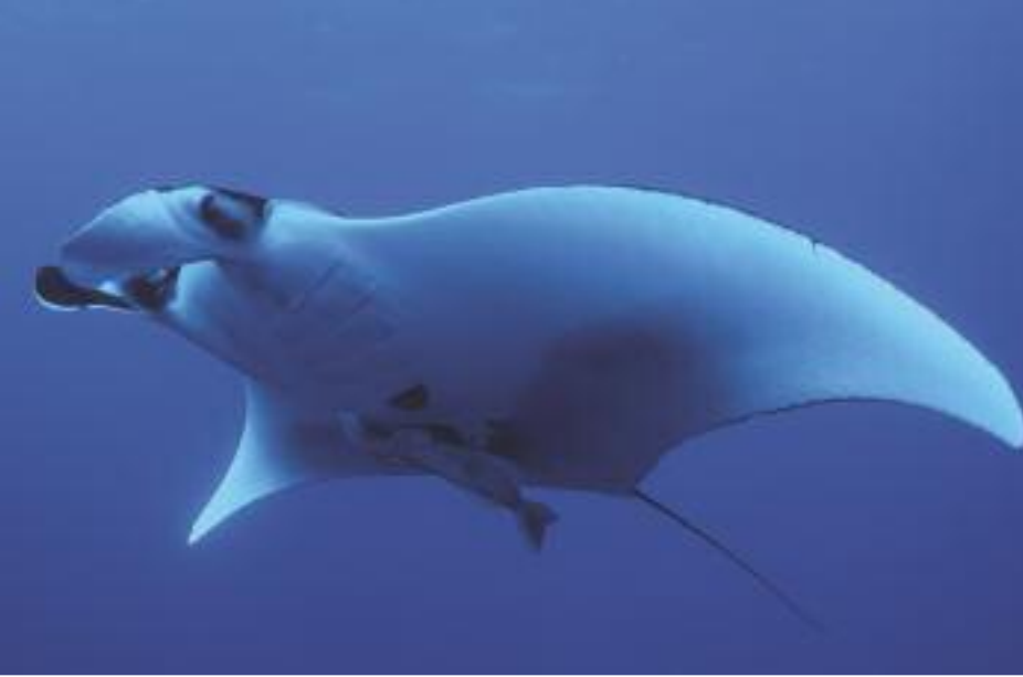
Raie Manta, île de Socorro, Mexique