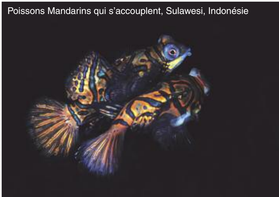
Poissons Mandarins qui s'accouplent, Sulawesi, Indonésie