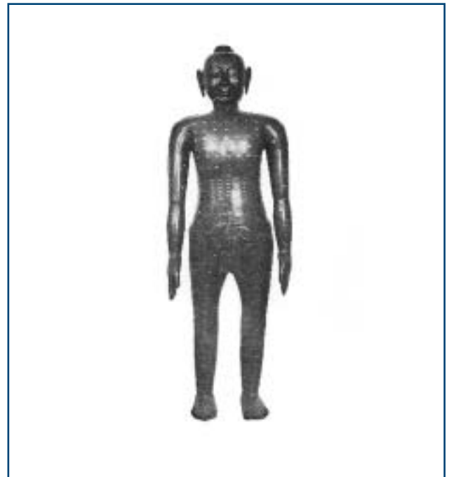
Figure 1. Statue de bronze du temps de la dynastie des Ming en 1443 montrant les points d'acupuncture.

En 1981, je rencontre pour la première fois le docteur Bruce Pomeranz qui faisait des recherches à l'hôpital de Toronto depuis quelques années sur les neuro-peptides. Il était l'un des premiers à avancer la notion des endorphines et le premier à apporter des preuves scientifiques en laboratoire sur l'efficacité analgésique de l'acupuncture. Sa première constatation fut que l'effet de l'analgésie en acupuncture était transmissible, c'est-à-dire qu'un certain facteur sanguin biochimique était généré par l'acupuncture. Si l'on transfusait le sang de l'animal analgésié par l'acupuncture à un receveur, cette même analgésie était reproduite. Le docteur Pomeranz découvrit également qu'il pouvait bloquer l'effet analgésique de l'acupuncture chez le rat en injectant de la naloxone. Il trouva des peptides et le taux de ceux-ci avait augmenté à la suite d'une séance d'acupuncture. Les endorphines venaient de voir le jour en sol canadien. Plusieurs expériences à répartition aléatoire et à double insu